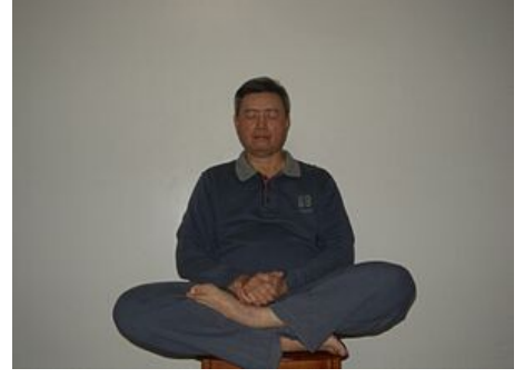
Neidan antrenmanı (鄧豐洲內丹術打坐)

Jing "öz", fiziksel bedenin enerjilerine atıfta bulunur. Ölüm kişinin tüketen neden olduğunu fikrine dayanarak Jing , Taocu içsel simya koruyarak iddia Jing değilse, bir uzun ömürlü olmasını sağlamak için izin ölümsüzlük . (Schipper 1993, 154).