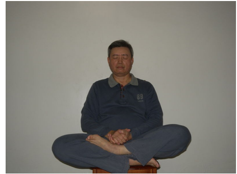
Neidan практика (鄧豐洲內丹術打坐)

Цзин "сущность", относящаяся к энергиям физического тела. Основываясь на идее, что смерть была вызвана истощением цзин, даосская внутренняя алхимия утверждала, что сохранение цзин позволяет человеку достичь долголетия, если не бессмертия . (Schipper 1993, 154).