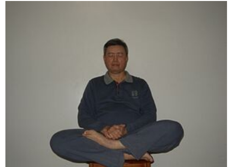
네이단 연습 (鄧豐洲內丹術打坐)

징 "본질"은 육체의 에너지를 가리킨다. 도이스트 내부 연금술은 자신의 징을 떨어뜨려 죽는다는 생각을 바탕으로 징을 보존하면 불멸은 아니더라도 장수를 이룰 수 있다고 주장했다. (Schipper 1993, 154).