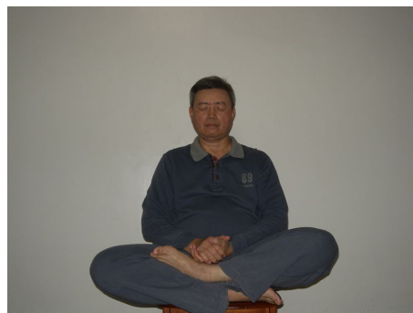
Neydan amaliyoti (鄧豐洲內丹術打坐)

Jing jismoniy tanadagi energiyalarga ishora qiluvchi "mohiyat". O'lim odamning tükenmesi tufayli sodir bo'lgan degan fikrga asoslanadi jing , Daoistlarning ichki alkimyosi saqlanib qolgan deb da'vo qilmoqda jing uzoq umr ko'rishga imkon berdi, agar bo'lmasa o'lmaslik . (Schipper 1993, 154).