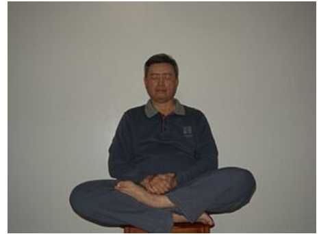
네이단 연습 (鄧豐洲內丹術打坐)

징 육체의 에너지를 가리키는 "본질". 죽음이 사람의 고갈로 인한 것이라는 생각을 바탕으로 징, Daoist 내부 연금술은 징 그렇지 않다면 장수를 달성 할 수있었습니다 불사 . (Schipper 1993, 154).