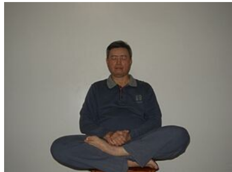
Neidan практика (鄧豐洲內丹術打坐)

Цзин "сущность", относящаяся к энергиям физического тела. Основываясь на идее, что смерть была вызвана истощением цзин, даосская внутренняя алхимия утверждала, что сохранение цзин позволяет человеку достичь долголетия, если не бессмертия . (Schipper 1993, 154).