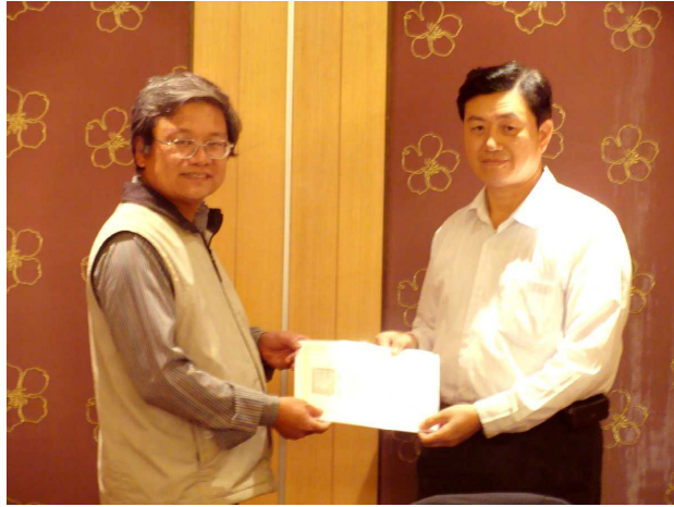
圖 3. 2009 年 2 月 12 日頒發當選證書