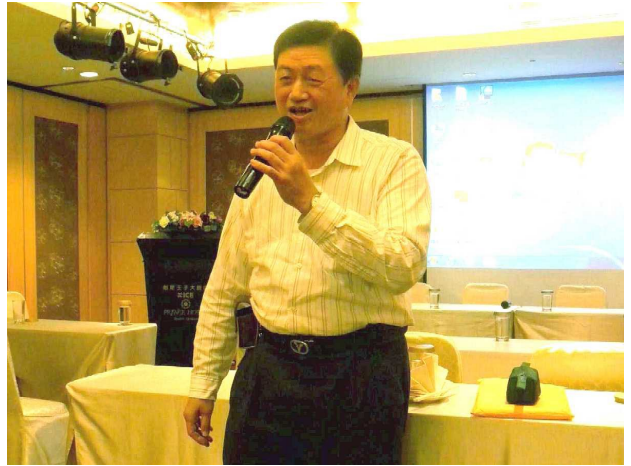
圖 4. 2013 年 1 月 11 日餘興節目