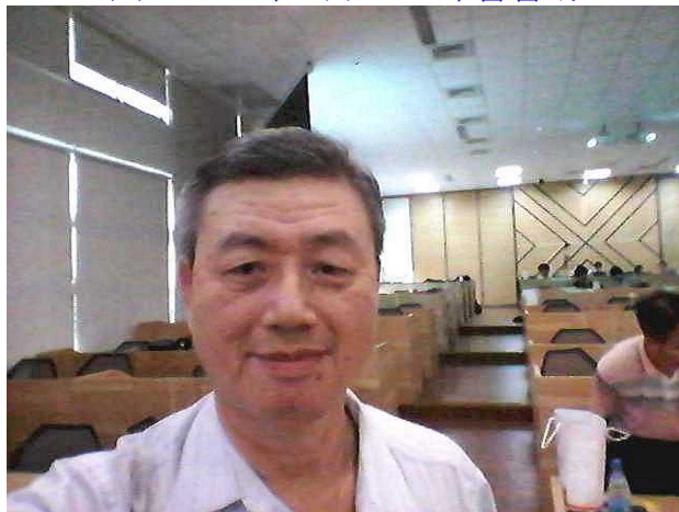
圖 5. 2016 年 9 月 23 日年會會場