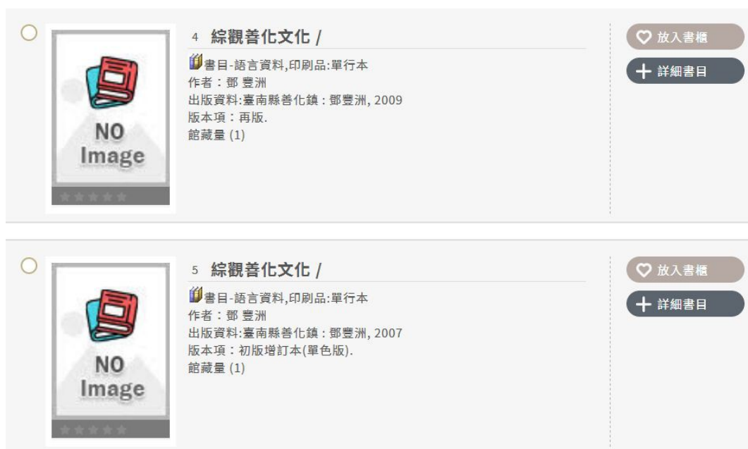
圖 2. 各圖書館典藏：鄧豐洲,《綜觀善化文化》,臺南縣: 作者,2009年6月。