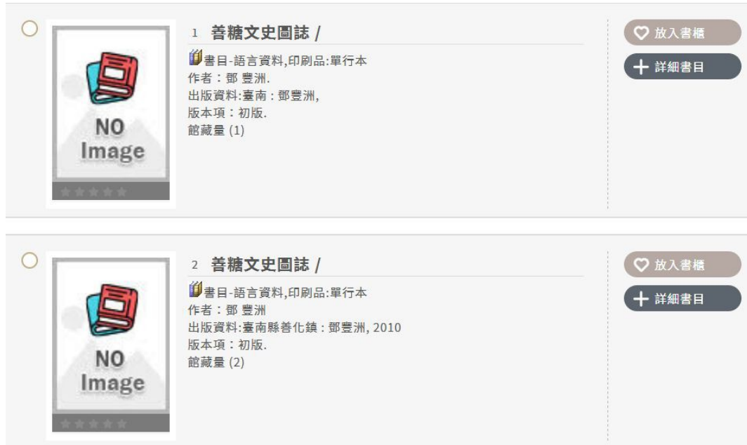
圖 4. 各圖書館典藏：鄧豐洲,《善糖文史圖誌》,臺南縣: 作者, 2010年10月。