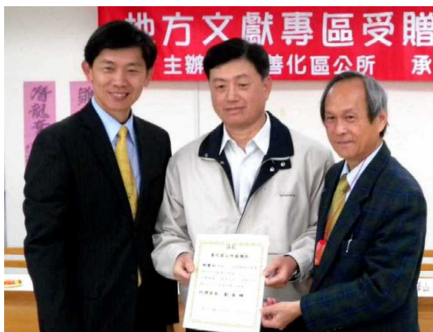
圖2. 善化區公所頒發感謝狀：100所文謝字第001號。

圖1. 2011年2月18日善化圖書館「地方文獻專區」受贈儀式，善化區公所頒發感謝狀。