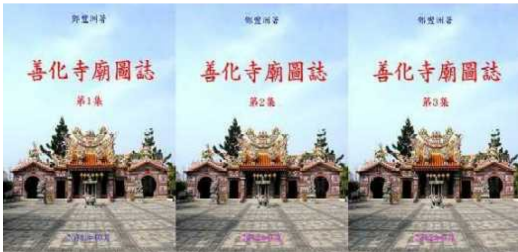
圖3. 鄧豐洲著，《善化寺廟圖誌》第1集及《善化寺廟圖誌》第2集 第3集，鄧豐洲，臺南市，2011年10月及2012年3月（A4版本）。

三、熱心參與詩人聯吟大會活動，榮獲優等獎，如圖4。並榮列於《善化鎮志》記載的「當代善化詩人」，如圖5。